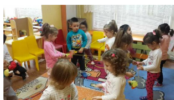
група „Червена шапчица“

По повод празника на нашия град в група „Славейче“ направиха постер с емблематични за родното ни място сгради! Децата с удоволствие и много радост разпознаха и назоваха повечето от тях!