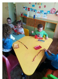
група „Червена шапчица“